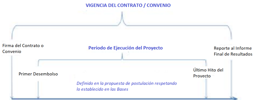
Figura 1. Vigencia y Periodo de Ejecución